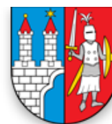
Miasto Kamienna Góra